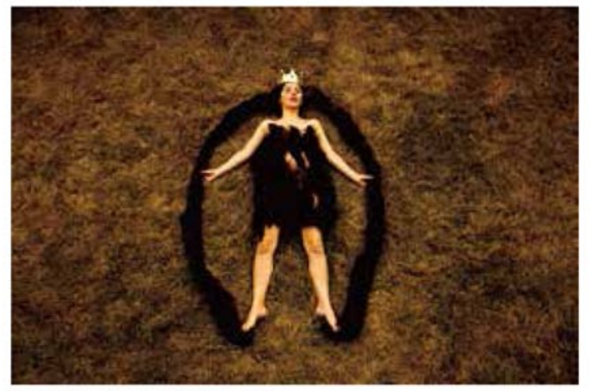
PISARIKOVA Karin ビサリコヴァ・カリン <Earth Goddess>digital print, 73.0x110.0cm, 2010年

博士論文題目 ニワ文化のデザイン論 一人の動きと空間構成の関係から 堤涼子 ツツミ・リョウコ (理論系)