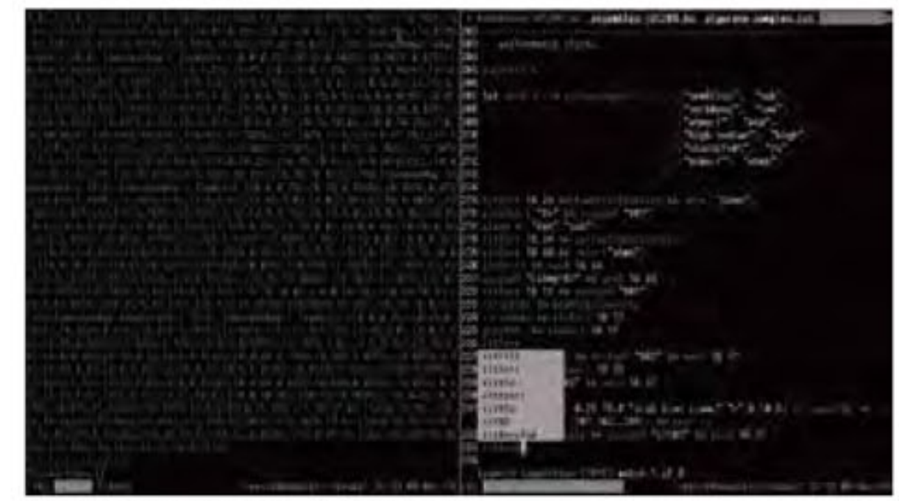
BELL Woodson Renick ベル・ウッドサン・レニック <Live coding screencast test in an experimental drum and bass algorave style, Dec. 9, 2014> デジタルビデオ、1600x900ピクセル、15分15秒、2014年