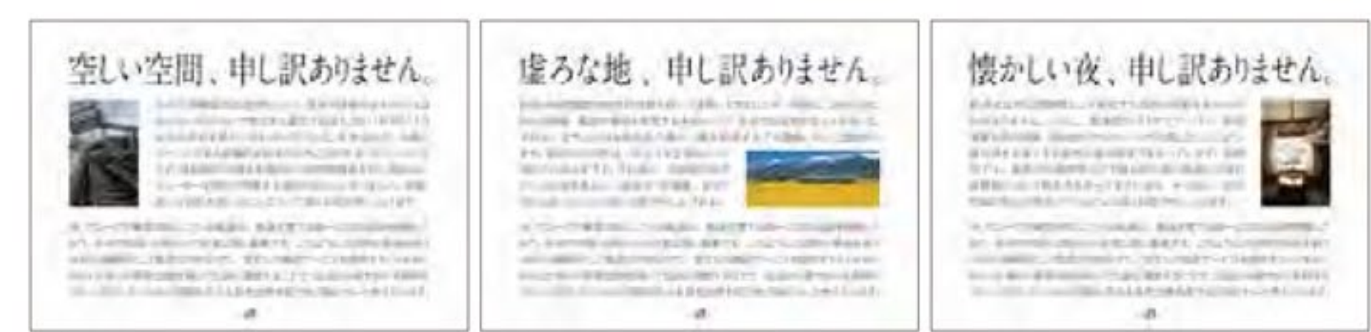
金宰弘 キム・ジェホン 《企業のCSR 駅貼りポスター》マット紙、インクジェットプリント 103.0x145.6cm(3点)、2014年(改訂)

2001年度に開設された多摩美術大学大学院美術研究科博士後期課程は、本年度第12期の学位取得者を出すことになりました。本課程は、美術・デザインにおける創作と理論の両面において高度の素質を備えた人材の養成を目的としています。院生たちは絵画・彫刻ほか、それぞれの研究分野に取り組むとともに、相互の討議を通じて幅広い視野を養ってきました。その研鑽の成果を問うべく第12回博士課程展を開催します。