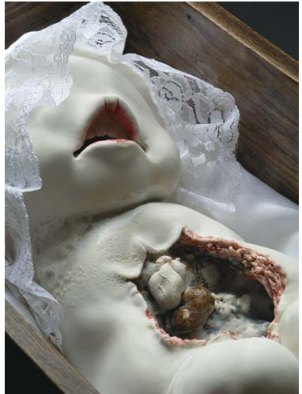
葬 / Funeral 陶 / Ceramic / 20 × 20 × 30 cm / (撮影：末正真礼生)