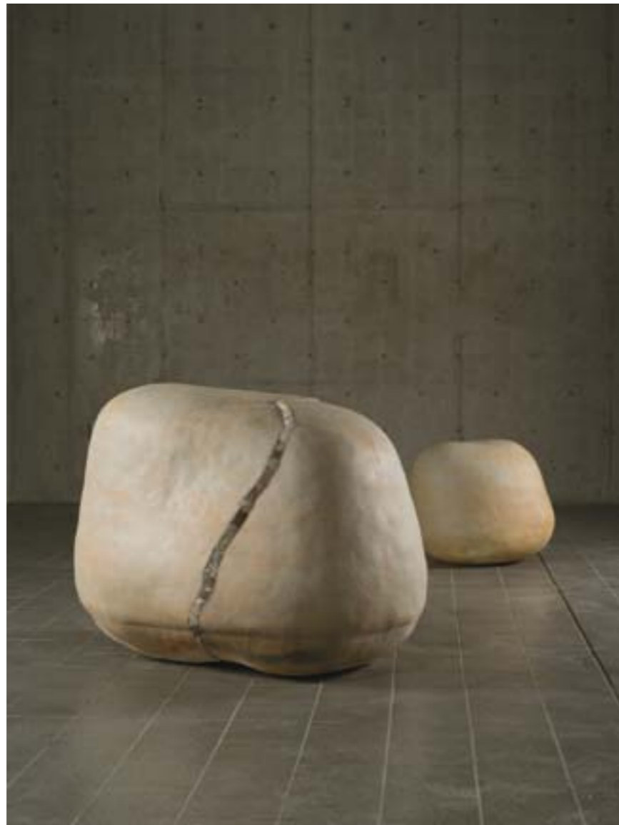
そこにいるひと そこにあるもの A person is there, a thing is there 陶 / Ceramic 手前：83 × 114 × 87 cm 奥：51 × 65 × 59 cm

The connection between artworks and other people