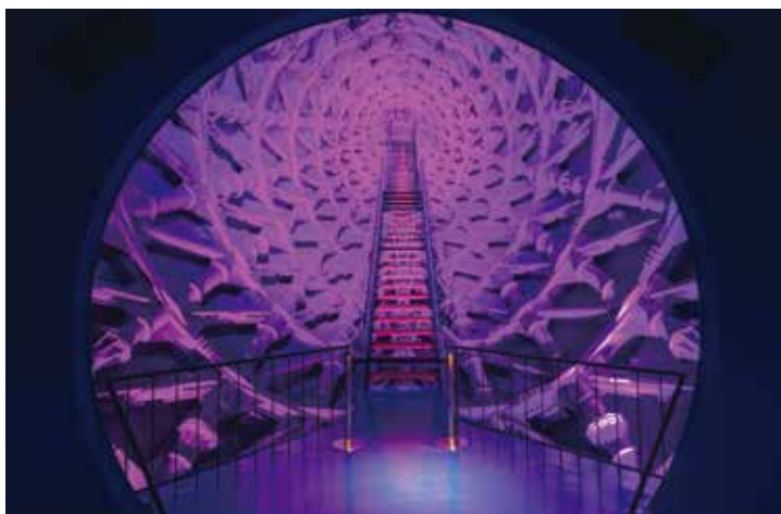
《太陽の塔》の腕の中から見ると…