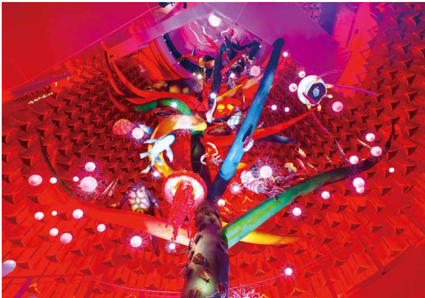
《太陽の塔》の内部。「生命の樹」がそびえ立つ様子は圧巻