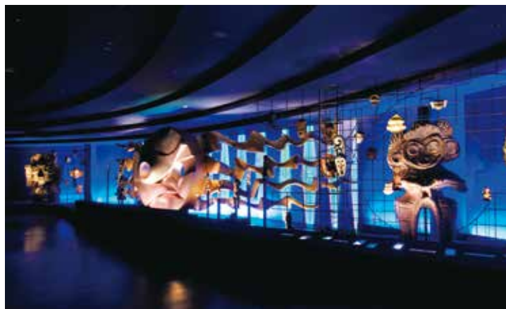
「地底の太陽」とずらりと並ぶ民族仮面