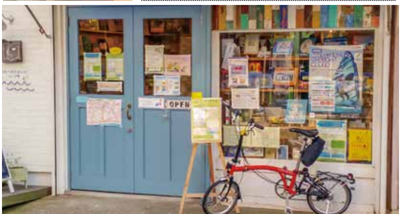
うみべのえほんや ツバメ号 外観

神奈川県横須賀市津久井 1-24-21 TEL&FAX:046-884-8661 URL : http://umibenohonya.com/