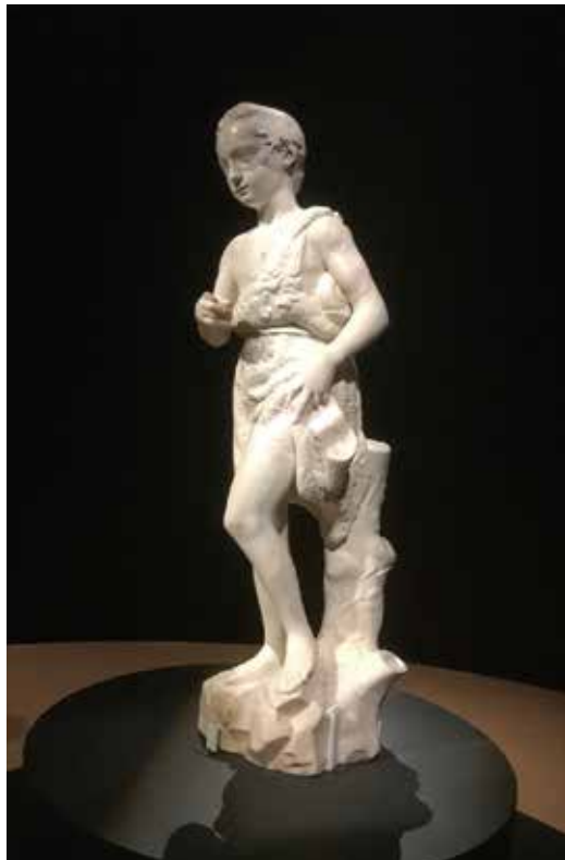
㊤《アメルングの運動選手》（紀元前1世紀、大理石、高さ131cm、フィレンツェ国立考古学博物館） 展示風景。古代ギリシャの彫刻家ミュロンが作った像の「ローマン・コピー」（古代ローマ時代の精密な模刻）とされる