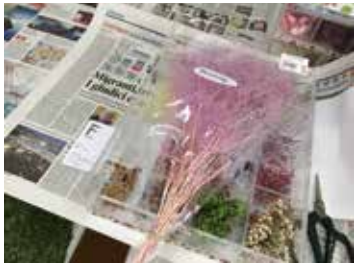
ハーバリウムの瓶に入れる素材。同じ植物でも様々な色に染められており、組み合わせは無限大だ