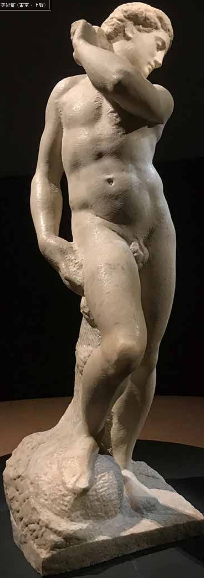
ミケランジェロ《ダヴィデ=アポロ》（1530年頃、大理石、高さ147cm、フィレンツェ、バルジェッロ国立美術館）展示風景。ギリシャ神話のアポロとダヴィデの両方の可能性があるため、この名称で呼ばれているという