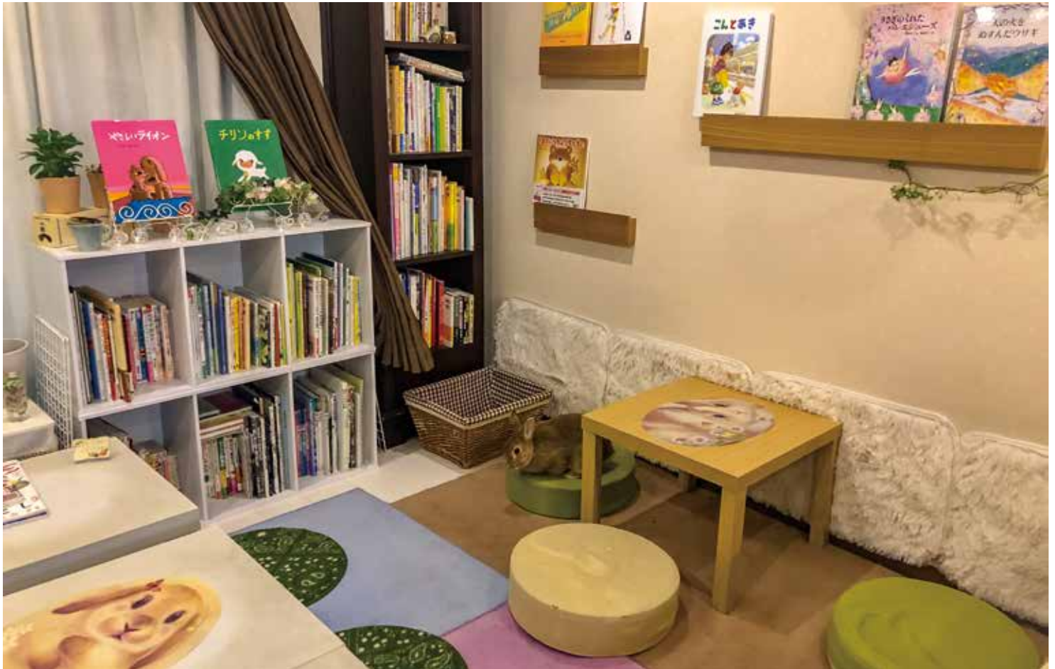
カフェ「うさぎの絵本」店内風景

絵本は子どもだけのものなのか？子どもの頃読んだ絵本は印象深く記憶の底に留まっている。おとなになって読み返してみると子どもの時とは違った感想を抱くこともある。おとなになってから絵本に触れるきっかけとなる場所、それが絵本カフェだ。東京・下北沢の「うさぎの絵本」と神奈川県横須賀市の「うみべのえほんや ツバメ号」を訪ねた。