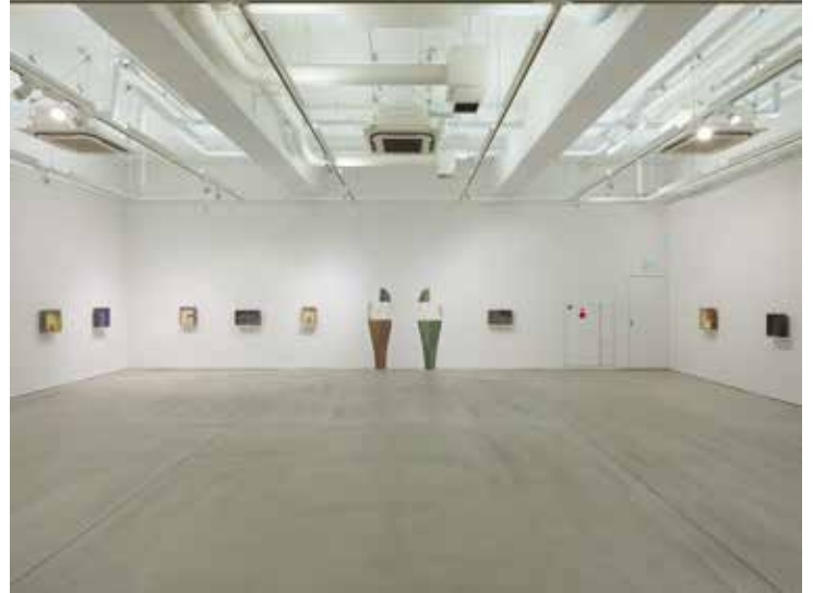
『室越健美展 匣(はこ)』の作品

1970年代後半、東京芸術大学へ進学した頃日本は高度経済成長期のさなかで、アメリカに追随するのが当たり前の時代だった。美術の世界でもアメリカから抽象表現主義などが流れ込み、「自分を含めて誰もがアメリカナイズに身を投じていた」という。一方で、その風潮にはずっと疑問を抱き続けていた。